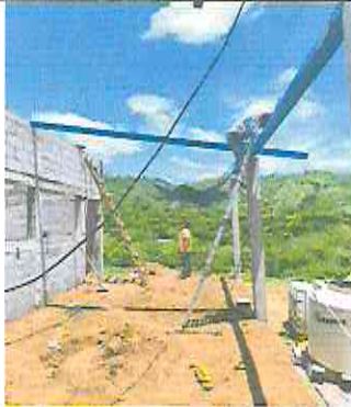
Foto 1: Sustitución de de lamina por lamina troquelada de aluzinc.