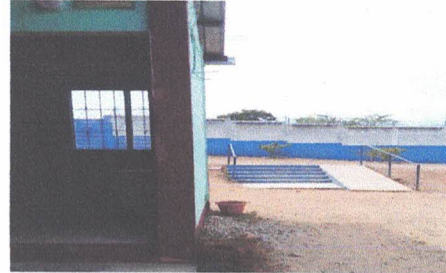
Foto 2: Dirección del caminamiento de ingreso el cual será techado y con piso de concreto en dirección a las aulas. ✓