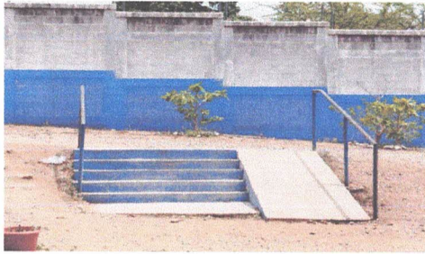
Foto 1: Muro donde colocara el ingreso al centro educativo, el mismo tendrá portón de ingreso, techo y chapa eléctrica. ✓