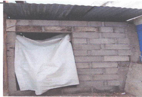
Foto 4: Área donde pretende establecer la cocina del centro educativo. ✓