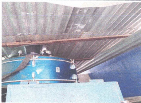
Foto 5: Techo de lámina y estructura de madera a sustituir por metal y lámina calibre 26. ✓