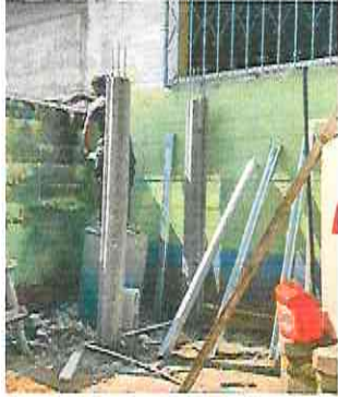
INSTALACION DE BASE PARA TANQUE DE AGUA