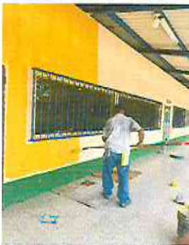
PINTURA EN EXTERIORES.