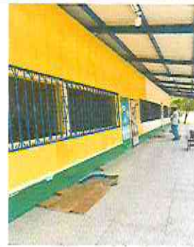
PINTURA EN EXTERIORES.

Observación: Si es necesario se pueden agregar hojas adicionales y actualizar el número de hojas.