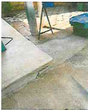
REPARACION DE TORTA DE CEMENTO Y ACERA