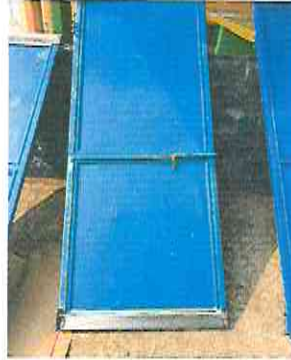
MATENIMIENTO A SEIS PUERTAS DE BAÑOS.