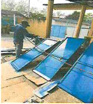
MANTENIMIENTO A SEIS PUERTAS DE BAÑOS