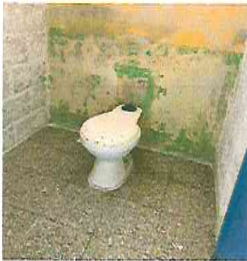
SUSTITUCION DE SANITARIOS CON SUS ACCESORIOS.