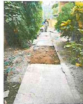
REPARACION DE TORTA DE CEMENTO EN PATIO