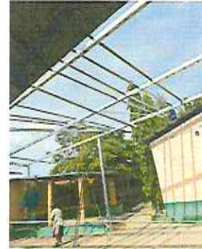
INSTALACION DE ESTRUCTURA DE METAL Y TECHO