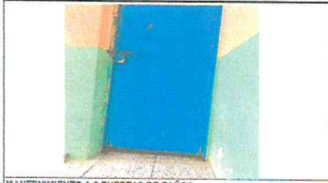
MANTENIMIENTO A 6 PUERTAS DE BAÑOS