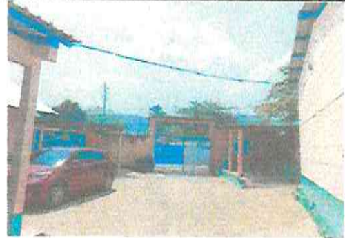
INSTALACION DE ESTRUCTURA DE METAL Y TECHO