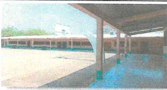
PINTURA EN EXTERIORES