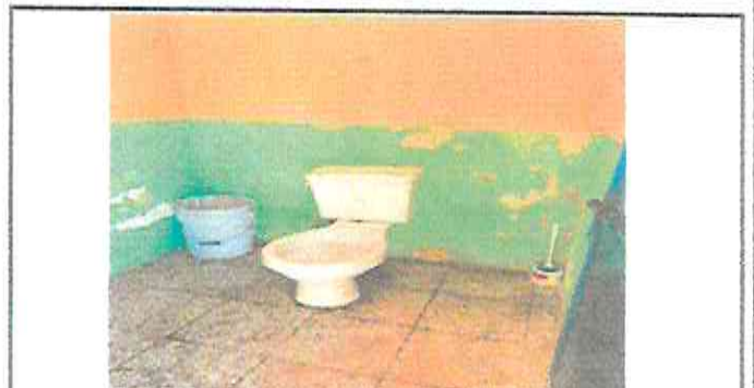
COLOCACION DE AZULEJO EN 6 BAÑOS