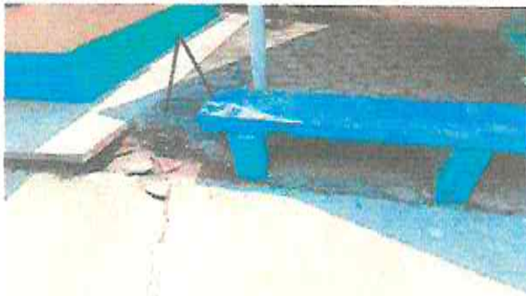
REPARACION DE TORTA DE CEMENTO Y ACERA