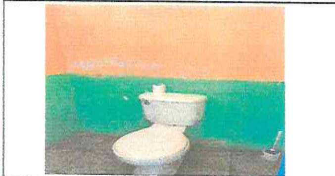
SUSTITUCION DE 2 SANITARIOS CON SUS ACCESORIOS