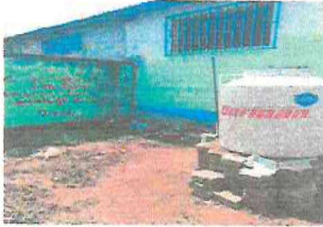
INSTALACION DE BASE PARA TANQUE DE AGUA