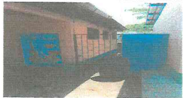
PINTURA EN EXTERIORES

Observación: Si es necesario se pueden agregar hojas adicionales y actualizar el número de hojas.