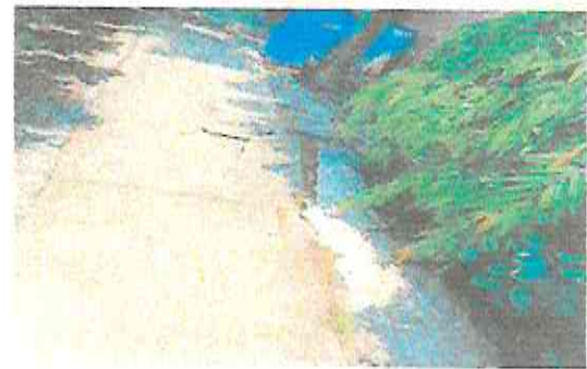
REPARACION DE TORTA DE CEMENTO EN PATIO