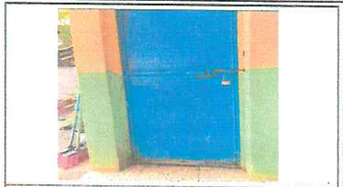
MANTENIMIENTO A 6 PUERTAS DE BAÑOS