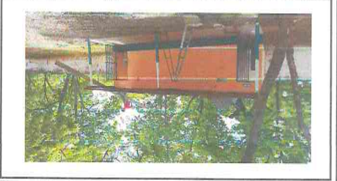
Foto 1: Área en donde se instalará estructura metálica para instalación de tanque elevado de 1,100 litros.