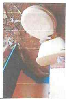
Foto 4: Sanitarios dañados, se propone la sustitución de los mismos, tomar en cuenta que el área de baños de niños los drenajes presentan obstrucción, se plantea la reparación del mismo.