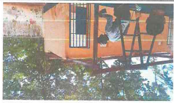
Foto 5: Techo de lamina dañada y estructura en malas condiciones, se propone la sustitución de lamina y el mejoramiento de la estructura + canales de agua pluvial y bajadas.