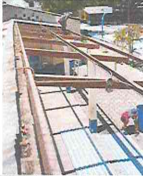
CAMBIO DE LAMINA EN AULA MODULO D 170 M2