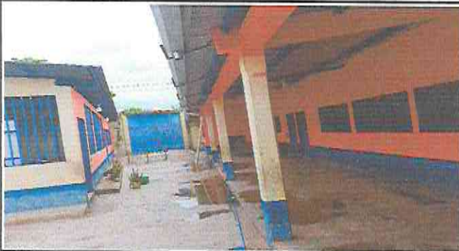
PINTURA EN EXTERIORES EN TODO EL ESTABLECIMIENTO EDUCATIVO