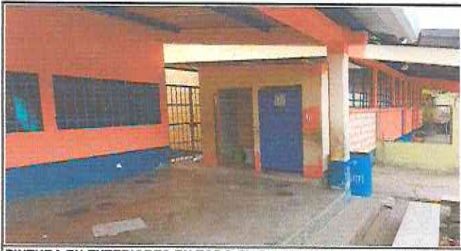
PINTURA EN EXTERIORES EN TODO EL ESTABLECIMIENTO EDUCATIVO