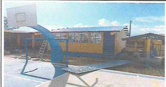
CAMBIO DE LAMINA EN AULA MODULO C 108 M2