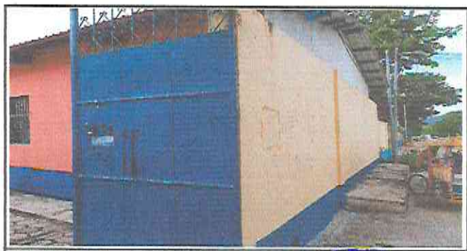
PINTURA EN EXTERIORES EN TODO EL ESTABLECIMIENTO EDUCATIVO

Observación: Si es necesario se pueden agregar hojas adicionales y actualizar el número de hojas.