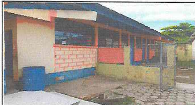
PINTURA EN EXTERIORES EN TODO EL ESTABLECIMIENTO EDUCATIVO