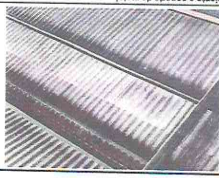
3.2 mantenimiento a soporte de metal