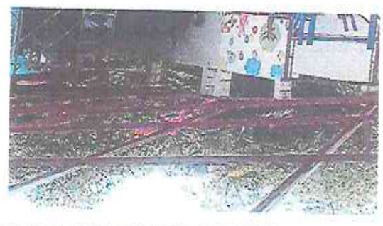
2.3 mantenimiento a estructura de soporte de metal