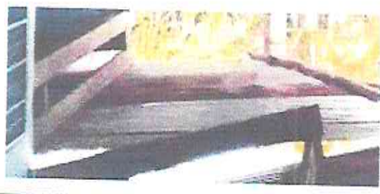
2.2 sustitucion de soporte de madera por metal