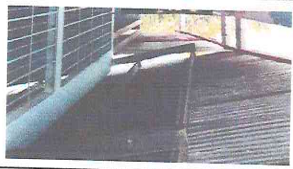
2.1 Sustitucion de lamina por lamina troquelada (modulo de corredor)