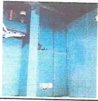
3.1 mantenimiento de puertas de metal