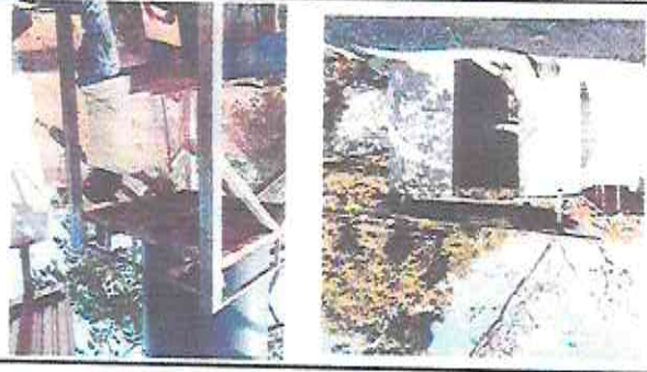
4.2 circunsccion puerta en cocina mantenimiento estructura metallas de tinaco