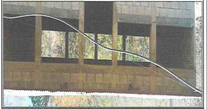
Foto 3: Fabricación e instalación de ventanas de 2,2 m. de ancho y 1,50 m. de alto.