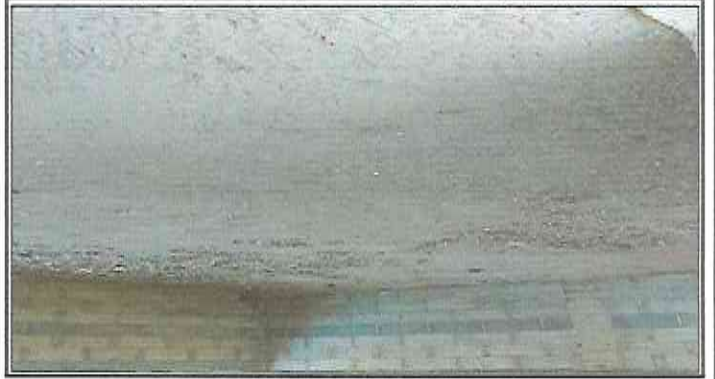
Foto 1: Sustitución de torta de piso de concreto más construcción de piso cerámico.