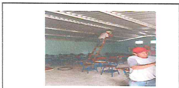
Foto 4: Electricista coloca las plafoneras en las aulas de los grados de primero, segundo y tercero básico