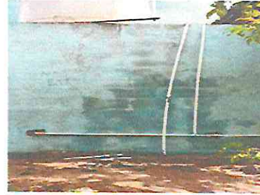
Foto 2: Albañil coloca la tubería que va para el rotoplas y los baños.