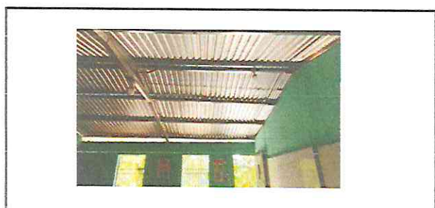
Foto 6: El electricista hace cambio plafonera, apagadores, tomacorriente, flapon y cableado eléctrico de las aulas de primero, segundo y tercero básico.

Observación: Si es necesario se pueden agregar hojas adicionales y actualizar el número de hojas.