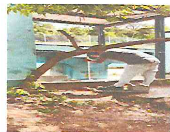
Foto 6: Sustitución de tubería y accesorios de rotoplas de agua de los baños.

Observación: Si es necesario se pueden agregar hojas adicionales para actualizar el número de hojas.