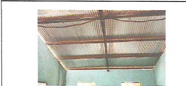
Foto 1: El electricista coloca el cableado eléctrico en las aulas de primero, segundo y tercero básico.