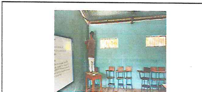
Foto 5: El electricista coloca el flapon en la aula de primero básico.