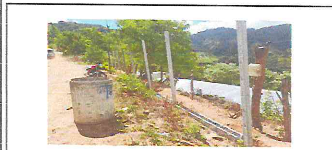
Foto 5: Albañiles colocan los postes para el lado de la calle y colocan las uves para sujetar la malla.