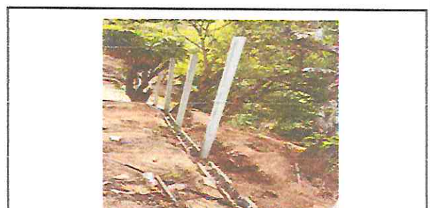
Foto 4: Los albañiles colocan la torta de cemento para poder colocar la malla.