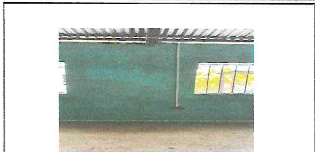
Foto 2: El electricista coloca los tomacorrientes en las aulas de primero, segundo y tercero Básico.