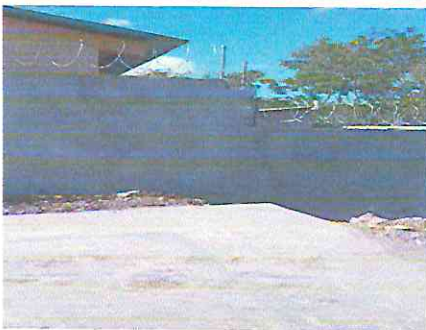
Foto 5: Reparación de muro perimetral de block y malla con columnas