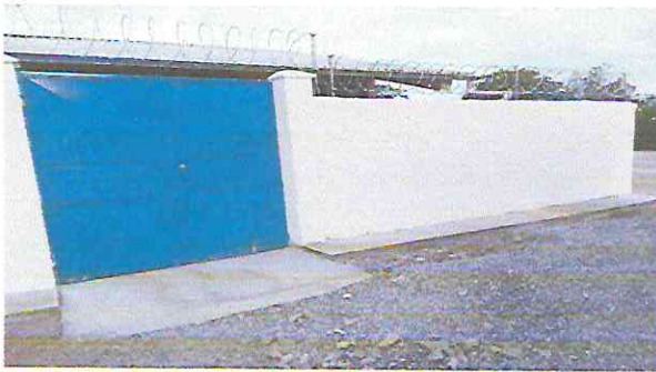
Foto 3: Reparación de muro perimetral de block y malla con columnas