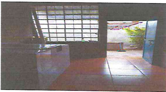
Foto 11: Instalación de piso cerámico de buena calidad PEI 5 con pegamento especial