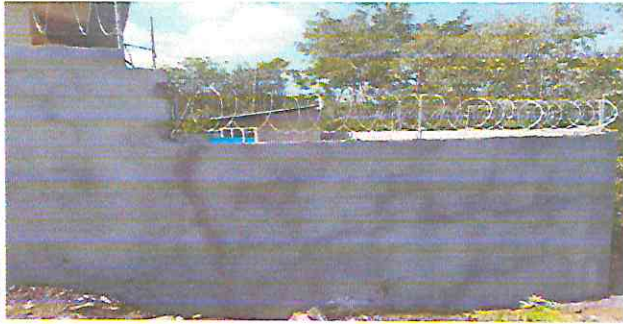
Foto 1: Reparación de muro perimetral de block y malla con columnas