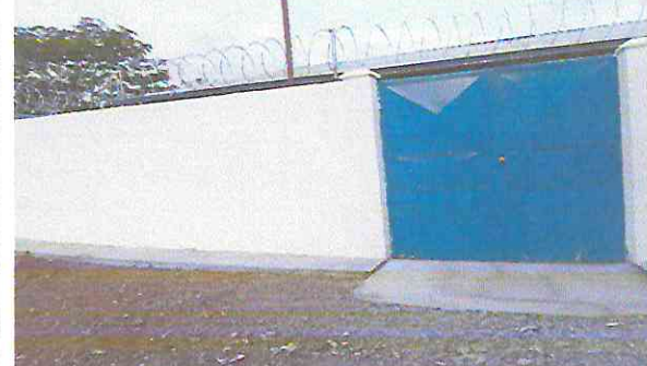
Foto 4: Reparación de muro perimetral de block y malla con columnas