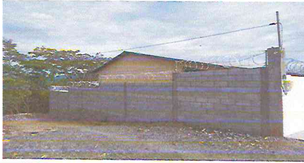
Foto13: Instalación de alambre tipo Reizon en metro lineal