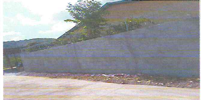
Foto 2: Reparación de muro perimetral de block y malla con columnas