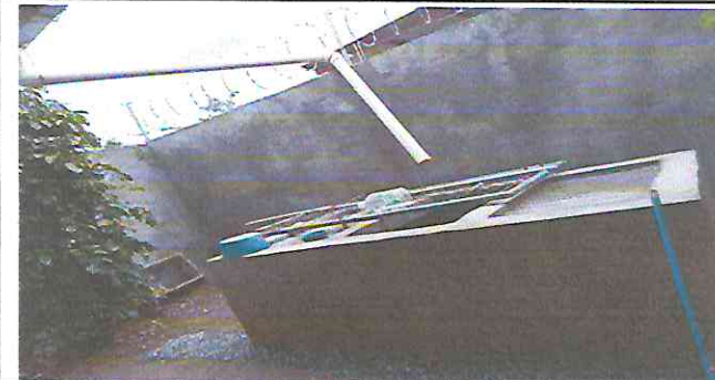
Foto 6: Sustitución de pila de cemento de dos labaderos por pila de concreto

Observación: Si es necesario se pueden agregar hojas adicionales y actualizar el número de hojas.