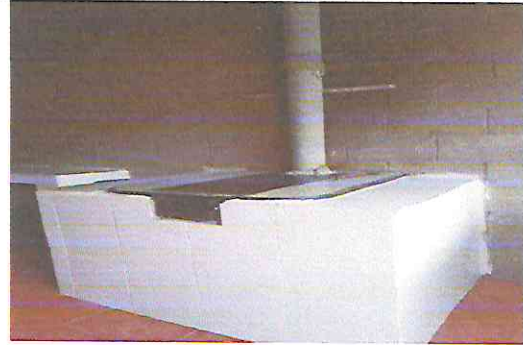
Foto 8: Sustitución de estufa Rural ahorradora con plancha de metal