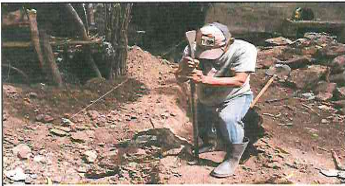
Realización de sanjeo antes del muro perimetral