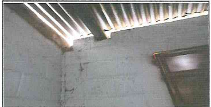
covering of holes in classroom wall