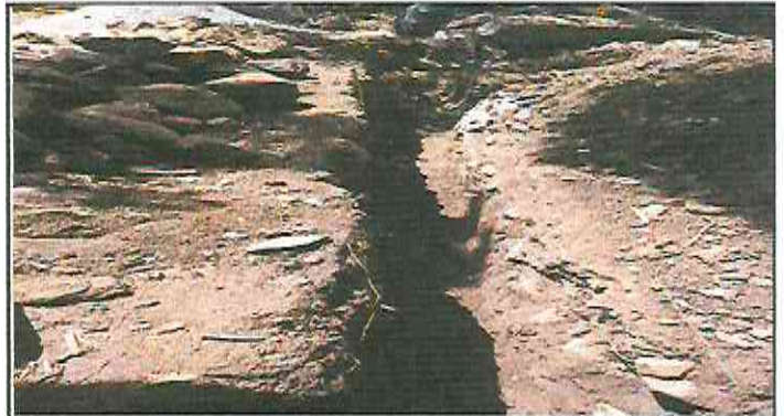
Inicio del sanjeo en la elaboración de muro.