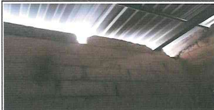
holes that are covered in the walls of classrooms