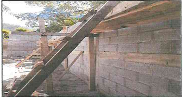
wall to the height of the last beam of the perimeter wall.