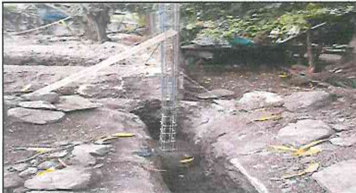
colocación de columnas, y los arranques de muro