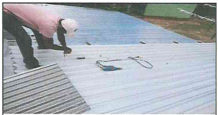
screwing sheets, on roof.

Observación: Si es necesario se pueden agregar hojas adicionales y actualizar el número de hojas.