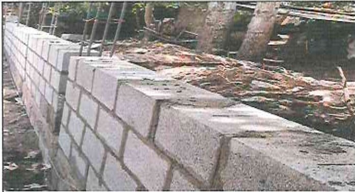
wall to the height of the first beam.