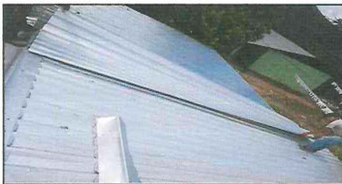
change of sheets, on roof in poor condition