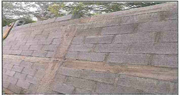
altura del muro perimetral casi terminado