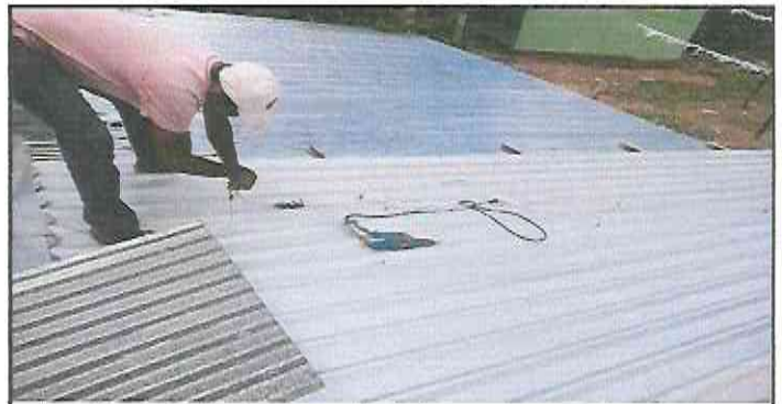
colocación de dos laminas, en mal estado.

Observación: Si es necesario se pueden agregar hojas adicionales y actualizar el número de hojas.