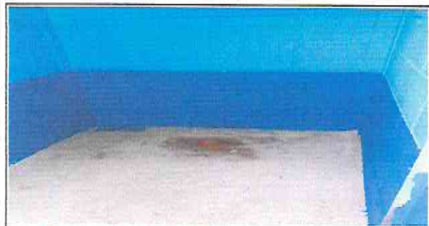
Foto 11. Sustitución de sanitarios.