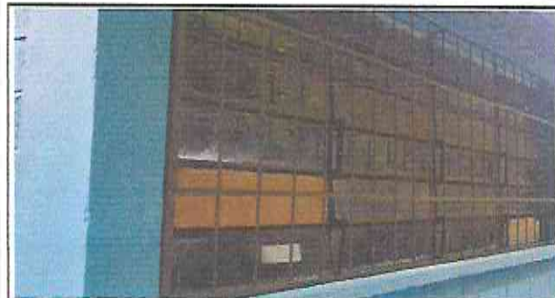
Foto 9. Fabricación e instalación de balcones de hierro en ventanas.