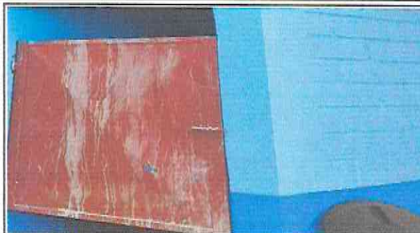
Foto 8. Pintura en puertas.