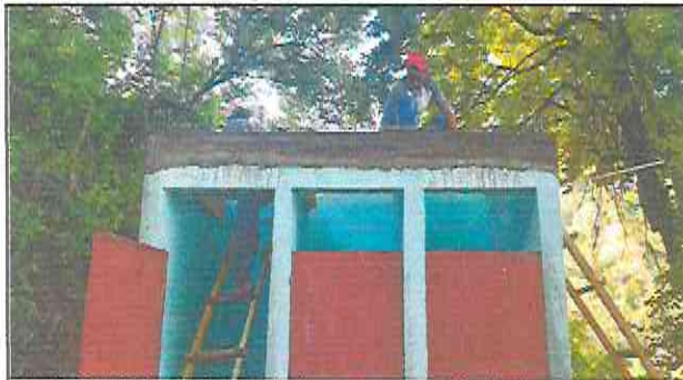
Foto 1: Fundición de loza en baños para colocación de deposito de agua.