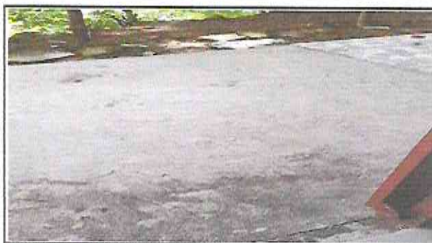
Foto10. Instalación de piso cerámico.