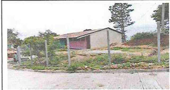
Foto1: Circulación de escuela con malla y postes de concreto