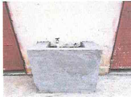
Lavamanos de concreto