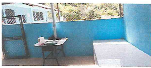
Foto 3: Sustitución e instalación de polletón con estufa chispa con azulejo.