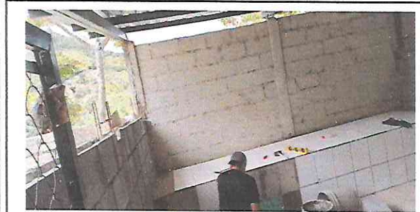
Foto 3: Sustitución e instalación de polletón con estufa chispa con azulejo.