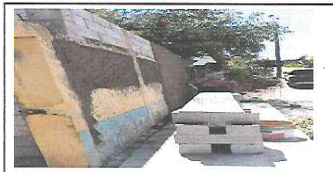
Foto 6: Avance del repello en la parte exterior del muro perimetral.

Observación: Si es necesario se pueden agregar hojas adicionales y actualizar el número de hojas.