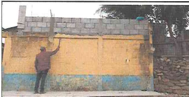
Foto 5: Preparación del area para el repello del muro perimetral.