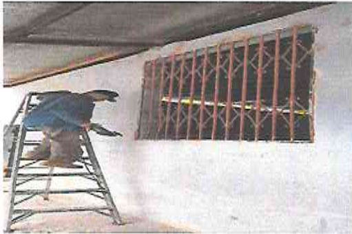
Foto1: Desmontaje del balcon de salon de clases.