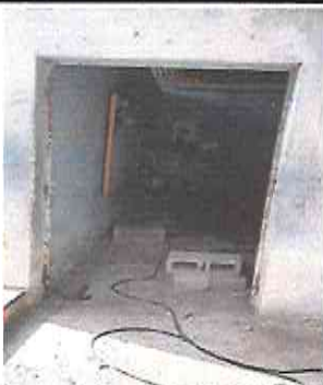
Foto 3: Preparacion del area para la instalacion de la puerta del salon de clases