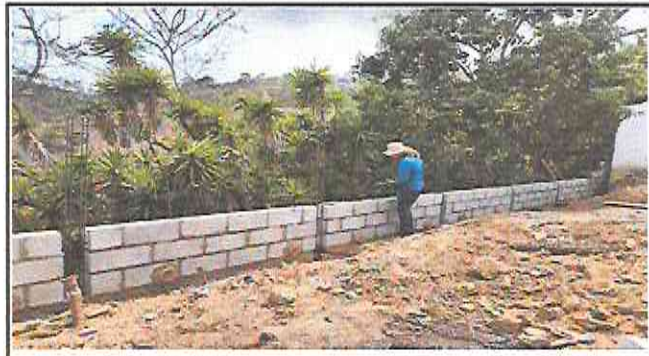
Foto 2 Avance de muro perimetral.