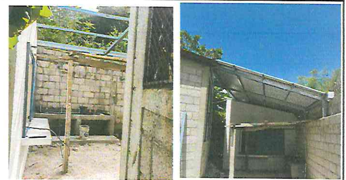
Foto 10: Area de comedor: Sustitución de lámina por lámina troquelada aluzin calibre 26 y sustitución de estructura de soporte de madera por metal.