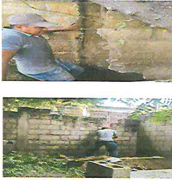
Foto1: muro perimetral: Reparacion de muro perimetral.