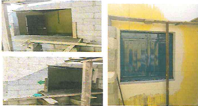
Foto 7: Cocina: Mesada en ventana con azulejo, instalación de ventana metálica.