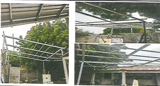
Foto 11: Escenario: Sustitución de lámina por lámina troquelada aluzin calibre 26 y sustitución de estructura de soporte de madera por metal.