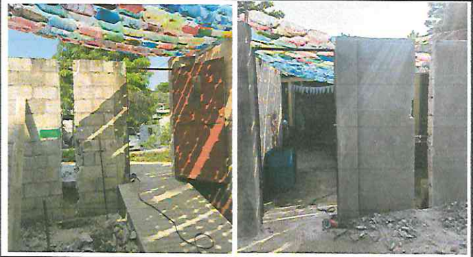
Foto 2: muro perimetral: Ampliar espacio de portón de ingreso, sustitución de portón de metal de ingreso.