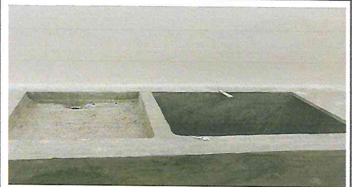
Foto 4: Cocina: Repello en muros, cernido en muros, tratamiento de humedades.