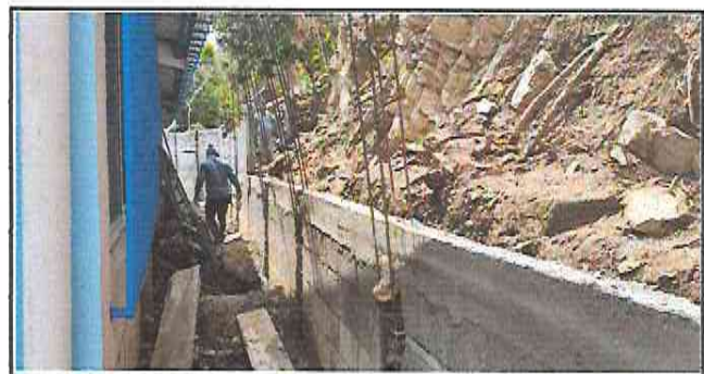
Foto 6: Albañiles pegando block y fundiendo columnas y vigas, en el muro de contención.

Observación: Si es necesario se pueden agregar hojas adicionales y actualizar el número de hojas.