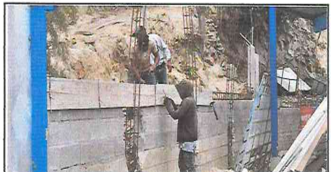
Foto 12: Albañiles fundiendo la viga y las columnas del muro de contención.

Observación: Si es necesario se pueden agregar hojas adicionales y actualizar el número de hojas.