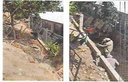
Foto 16: Albañiles trabajando en la reparación del muro de contención.