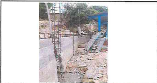
Foto 11: Colocación de estructura de varillas para la fundición de viga y columnas, en el muro de contención.