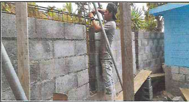
Foto 5: Colocación de estructura de varillas, para la fundición de la segunda viga, en el muro de contención.