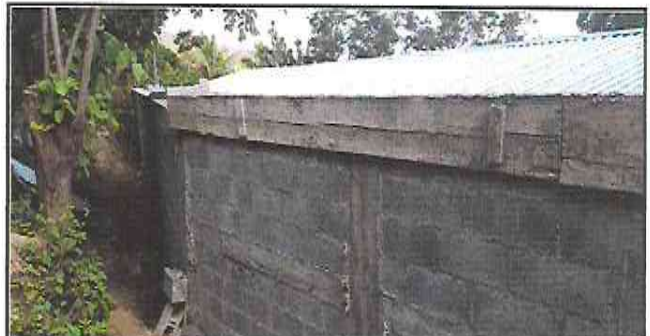
Foto 18: Fundición de viga y marquesina lado dentro de la escuela, en el muro de contención.

Observación: Si es necesario se pueden agregar hojas adicionales y ubicar el número de hojas.