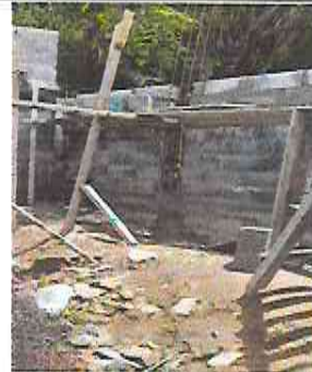
Foto 14: Colocación de hiladas de block, en el muro de contención.