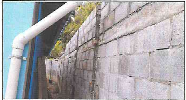
Foto 8: Colocación de hiladas de block después de la fundición de la segunda viga en el muro de contención.