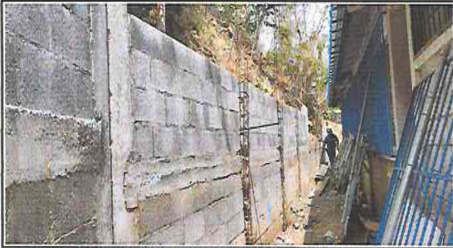
Foto 7: Colocación de hiladas de block después de la fundición de la viga, en el muro de contención.