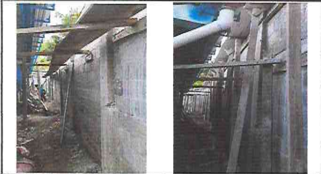
Foto 9: Colocación de tablas para la fundición de la marquesina, en el muro de contención.