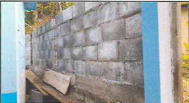
Foto 3: Colocación de hiladas de block, en la reparación del muro de contención.