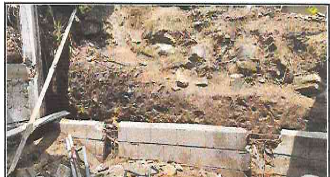
Foto 4: Preparación de columnas para su fundición, en el muro de contención