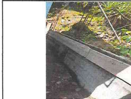
Foto 2: Fundición de viga, en la reparación del muro de contención