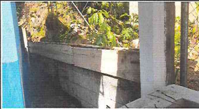
Foto 1: Fundición de viga, en la reparación del muro de contención