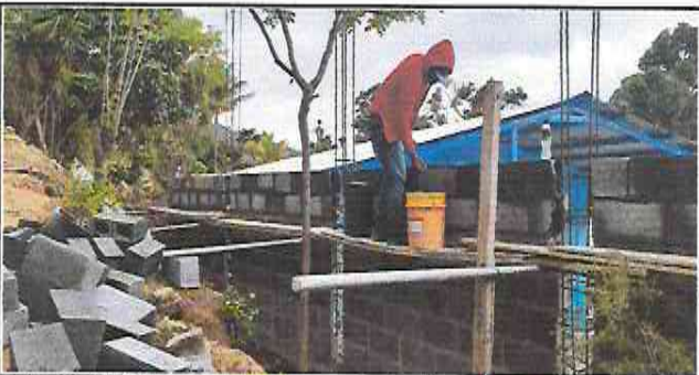
Foto 17: Albañil pegando block, para dar la altura al muro de contención.