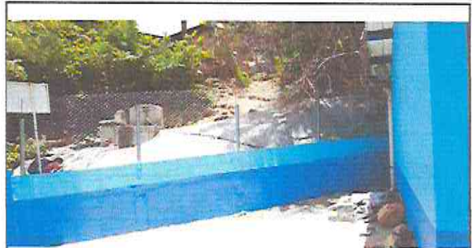
Foto 2: Reparación de muro perimetral de block con tubo hg y malla galvanizada.