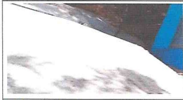
Foto1: Reparación de cuneta de concreto