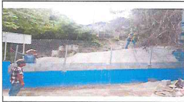
Foto 2: Reparación de muro perimetral de block con tubo hg y malla galvanizada.