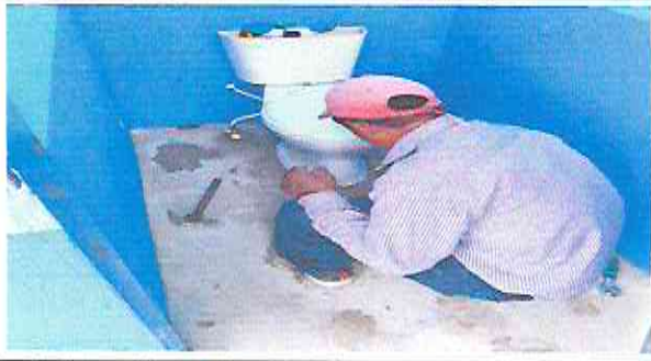
Foto7: Reparación de letrina