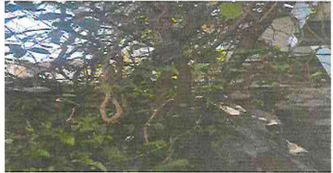
Foto 2: Reparación de muro perimetral de block con tubo hg y malla galvanizada.