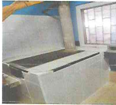
Foto 10: Fundición de polletón con azulejo e instalación estufa ahorradora.