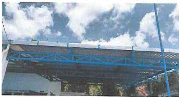
Foto 5: En la siguiente imagen se puede observar el resultado final del trabajo realizado.