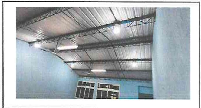
Foto 4: Luces funcionando correctamente en todas las áreas intervenidas.