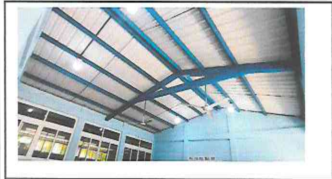
Foto 3: Trabajo de sustitución de plafoneras y bombillas finalizado.