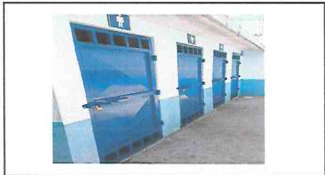
Foto1: Resultado final del trabajo realizado en el área de servicios sanitarios.