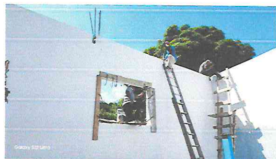
Foto 6: Terminación del tallado para la ubicación de nuevas ventanas y balcones que reemplazarán las que están en malas condiciones.

Observación: Si es necesario se pueden agregar hojas adicionales y actualizar el número de hojas.