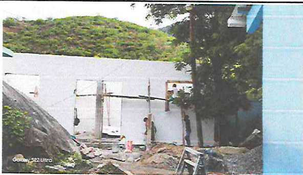
Foto 5: Tallado de marco de puertas para colocación de las nuevas puertas que sustituirán las que se encontraban en mal estado.