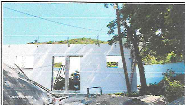
Foto 4: Avances del seguimiento del levantamiento de paredes de aula.