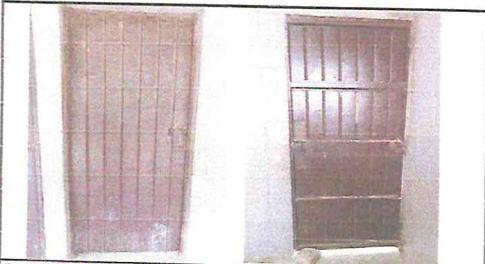
Foto 3: Sustitución de puertas. Debido al mal estado en que estas se encuentran.