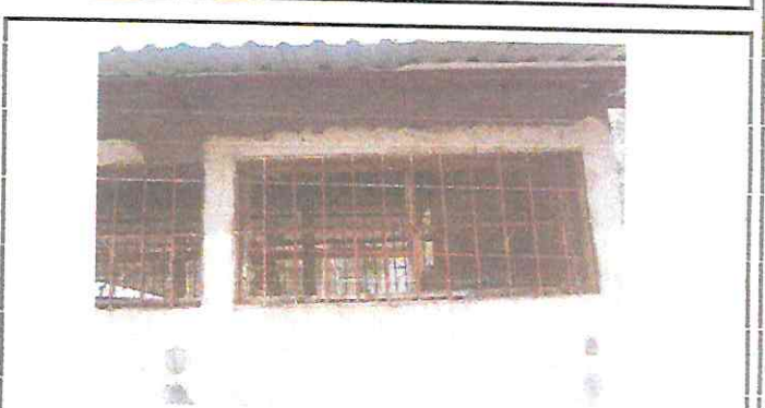
Foto 4: Reparación de repello y cernido de paredes de aulas. Debido al mal estado de estas.