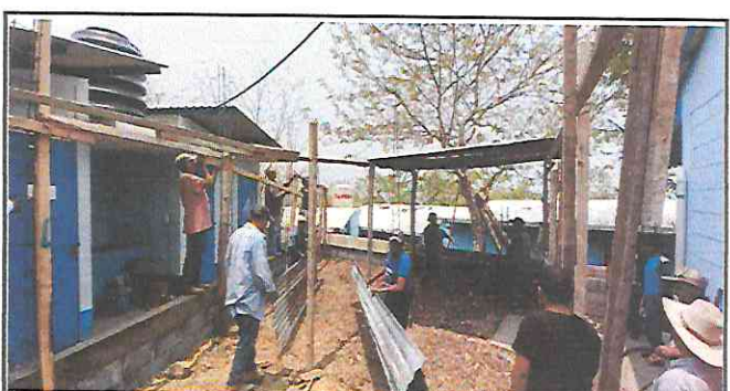
Foto 6: Trabajadores quitando el techo de lámina que se encontraba en malas condiciones.

Observación: Si es necesario se pueden agregar hojas adicionales y actualizar el número de hojas.