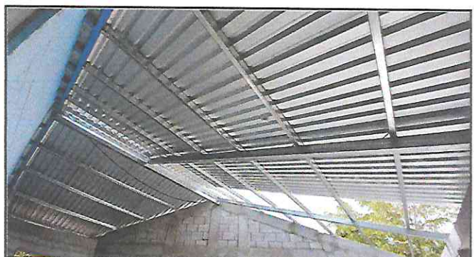
Foto 4: Instalación de lámina troquelada aluzinc calibre 26 con tornillera de fijación, en el aula.