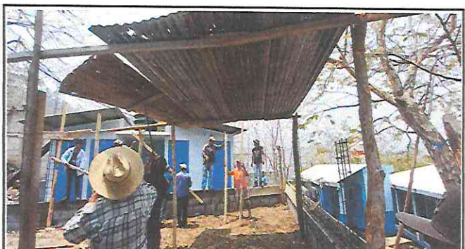
Foto 4: Trabajadores quitando el techo de lámina que se encontraba en malas condiciones.