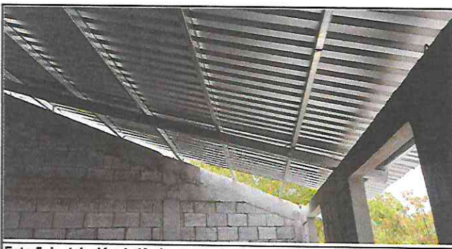
Foto 5: Instalación de lámina troquelada aluzinc calibre 26 con tornillera de fijación, en el aula.