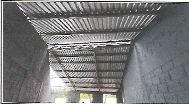
Foto 3: Instalación de lámina troquelada aluzinc calibre 26 con tornillera de fijación, en el aula.