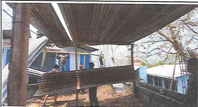
Foto 3: Trabajadores quitando el techo de lámina que se encontraba en malas condiciones.