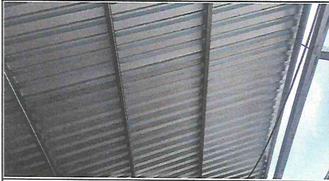
Foto 1: Instalación de lámina troquelada aluzinc calibre 26 con tornillera de fijación en el aula.