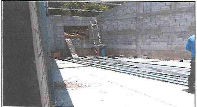
Foto 2: Herrero midiendo las costaneras galvanizadas para su instalación, para sustituir la estructura de soporte de madera por metal, en el aula.