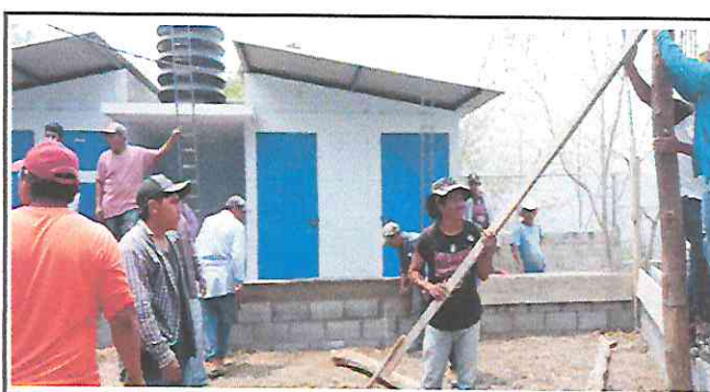
Foto 6: Trabajadores quitando la estructura de madera que se encontraba en malas condiciones.

Observación: Si es necesario se pueden agregar hojas adicionales y actualizar el número de hojas.