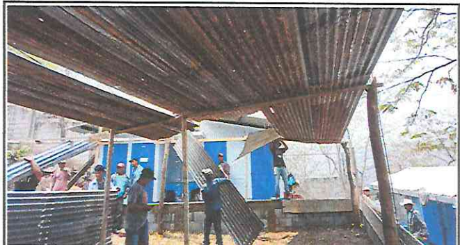
Foto 2: Trabajadores quitando el techo de lámina que se encontraba en malas condiciones.