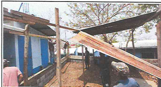
Foto 3: Trabajadores quitando la estructura de madera que se encontraba en malas condiciones.