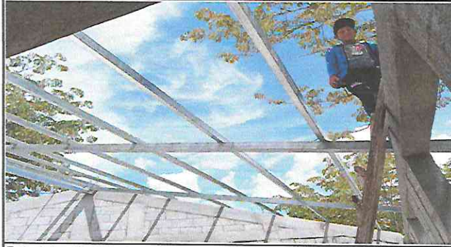
Foto 1: Instalación de costaneras galvanizadas, para sustituir la estructura de soporte de madera por metal en el aula.