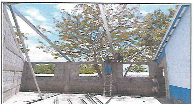
Foto 4: Herrero instalando los tubos cuadrados galvanizados, para sustituir la estructura de soporte de madera por metal, en el aula.