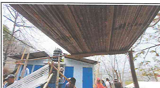
Foto 4: Trabajadores quitando la estructura de madera que se encontraba en malas condiciones.