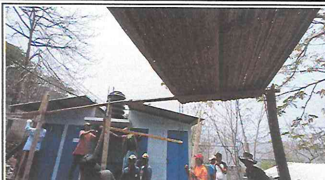
Foto 2: Trabajadores quitando la estructura de madera que se encontraba en malas condiciones.