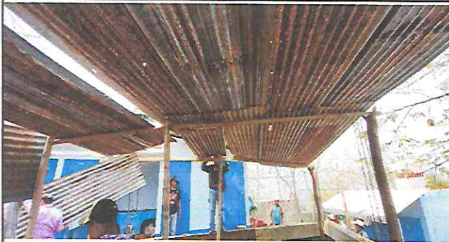
Foto 1: Trabajadores quitando el techo de lámina que se encontraba en malas condiciones.