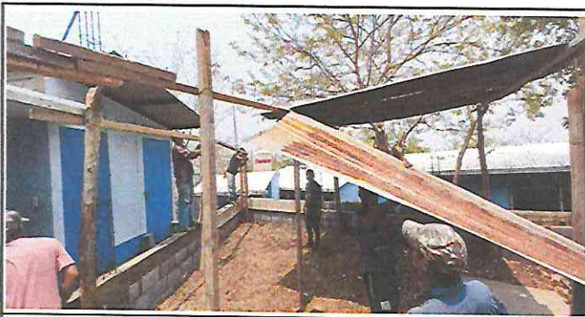
Foto 5: Trabajadores quitando el techo de lámina que se encontraba en malas condiciones.