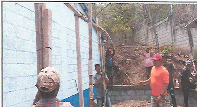
Foto 1: Trabajadores quitando la estructura de madera que se encontraba en malas condiciones.