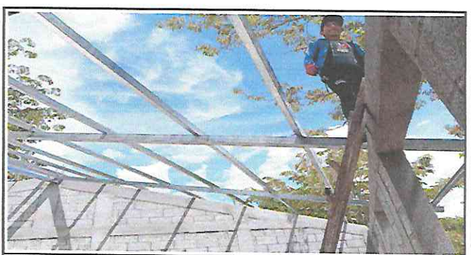
Foto 6: Instalación de la estructura de metal, para sustituir la estructura de soporte de madera por metal, en el aula.

Observación: Si es necesario se pueden agregar hojas adicionales y actualizar el número de hojas.