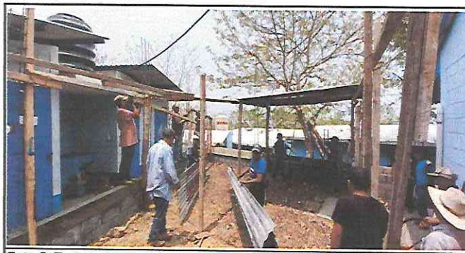
Foto 5: Trabajadores quitando la estructura de madera que se encontraba en malas condiciones.