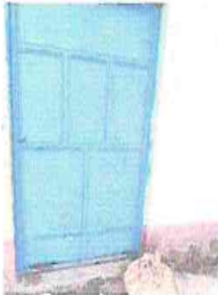
Foto 9: Mantenimiento de puertas, cocina, módulo 1.2.3 lijar, limpiar y pintar