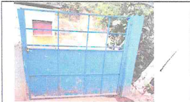
Foto1: Mejoramiento del portón, mantenimiento con pintura a portón principal