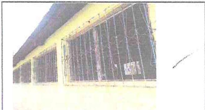
Foto 2: Lijar, limpiar y pintar balcones, cambiar tipo de persiana por ventana de metal corrodiza