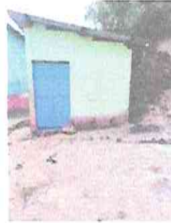
Foto 8: Mejoramiento de galera con lámina, troquelada alucin con estructura metálica