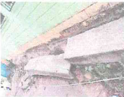
Foto 11: Protección a cemento patio parte trasera con block fundido

Observación: Si es necesario se pueden agregar hojas adicionales y actualizar el número de hojas.