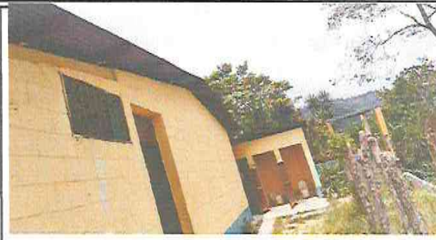
Foto 2:Modulo 2 Mejoramiento de baños, sustitucion de inodoros, mantenimiento puertas, cambio de lamina troqueleada y estructura.