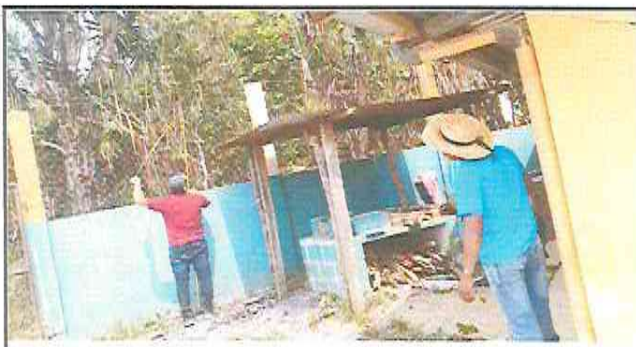
Foto 3:Modulo 3 Mejoramiento de cocina. Mejoramiento de galera por paredes de Block.