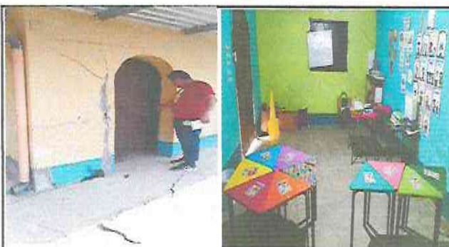
Foto 4: modulo 4 Mejoramiento con pintura y balcones instalacion de piso ceramico