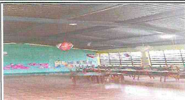
Foto1: Modulo1 sustitucion de lamina, por lamina troqueleada alucin calibre 26 y mantenimiento a estructura.