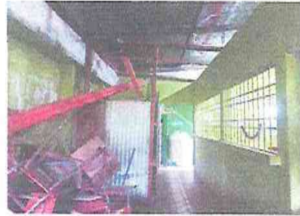
Foto 2: Sustitucion de estructura de soporte de metal, por metal.