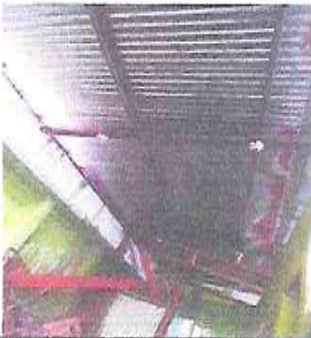
Foto 1: sustitución de lámina , por lámina troquelada aluzino calibre 26