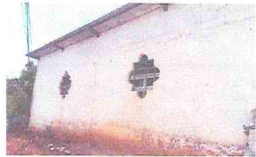
Foto 4: Se observa en la imagen que el establecimiento no cuenta con ventanas, se propone Suministro e instalación de ventanas PVC