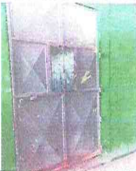
Foto 3: Las puertas se encuentran en mal estado por lo tanto se propone la sustitución de puertas de metal.