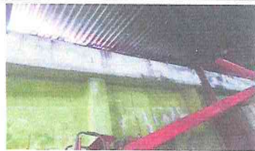
Foto 6: Las paredes se encuentran deterioradas por lo se realizaran repellos para contrarestar la humedad.

Observación: Si es necesario se pueden agregar hojas adicionales y actualizar el número de hojas.