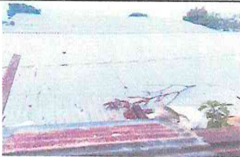
Foto 5: El establecimiento no cuenta con canales ni bajadas de agua, se propone la intalacion de canales de PVC