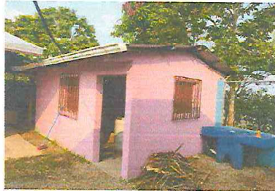
Foto1: Sustitución de de puerta de meta de 200 cm de alto por 100cm de ancho