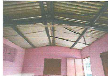
Foto 4: Sustitucion de estructura de metal de las ventanas de 150x 100 cm