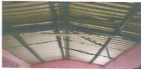
Foto 3: Sustitución de lámina, por lámina troquelada aluzinc calibre 26