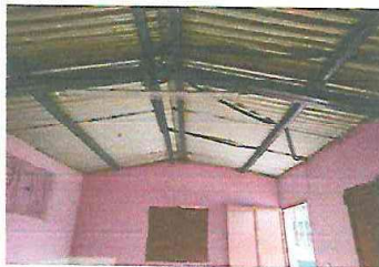
Foto 5: Sustitución de ventana de metal por ventana pvc de 150 x 100 cm