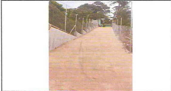
1.1. MEJORAMIENTO DE INGRESO A LA ESCUELA (RAMPA)