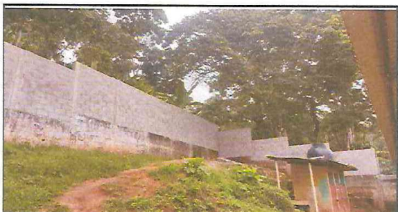
2.1. MEJORAMIENTO DE MURO PERIMETRAL CON BLOCK DE 15X40 PARTE DE ATRÁS

Observación: Si es necesario se pueden agregar hojas adicionales y actualizar el número de hojas.