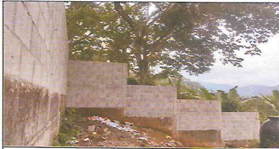
2.1. MEJORAMIENTO DE MURO PERIMETRAL CON BLOCK DE 15X40 PARTE DE ATRÁS