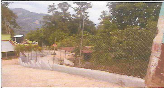
1.1. MEJORAMIENTO DE INGRESO A LA ESCUELA (RAMPA)