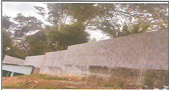
2.1. MEJORAMIENTO DE MURO PERIMETRAL CON BLOCK DE 15X40 PARTE DE ATRÁS