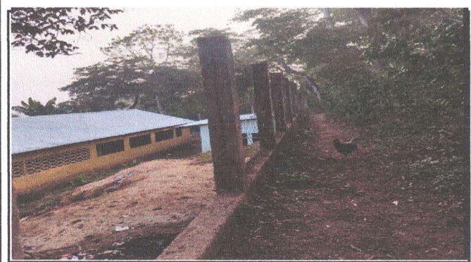
Foto 3: SUSTITUCION DE MALLA METALICA POR MURO DE BLOCK DE 15X40, A UNA ALTURA DE 1.90 MTS.