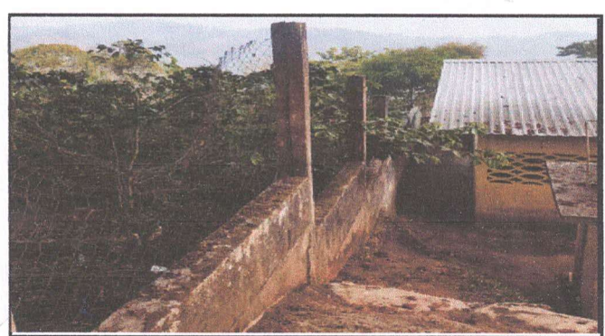
Foto 4: SUSTITUCION DE MALLA METALICA POR MURO DE BLOCK DE 15X45, A UNA ALTURA DE 1.90 MTS