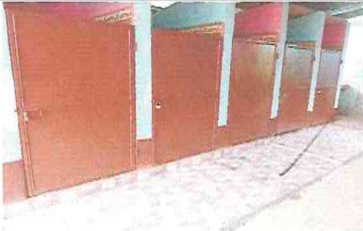
Foto 3: Mantenimiento de las puertas del baño y colocación de piso antideslizante.