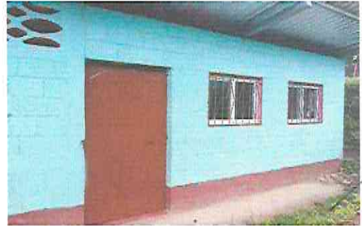
Foto 2: Instalación de ventanas de PVC y mantenimiento de balcones.