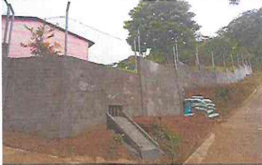
Foto 1: Finalización de reparación y repello de muro de contención.