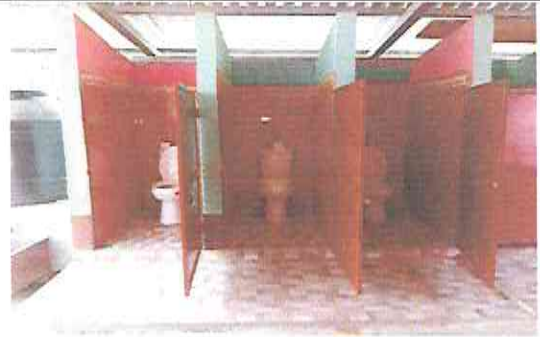
Foto 4: Cambio de sanitarios y colocación de azulejos en las paredes de los baños.