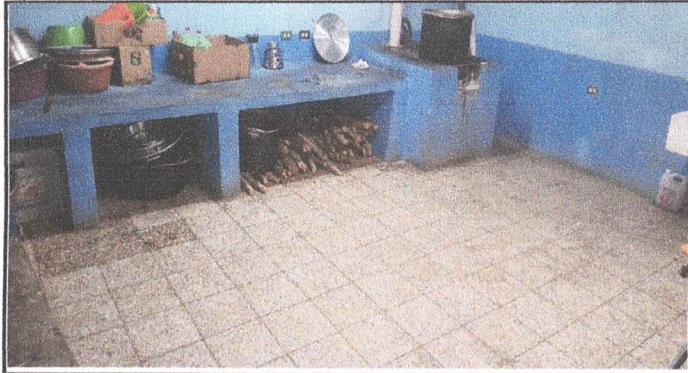
Foto7: INSTALACIÓN DE MESÓN DE TRABAJO