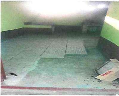
Foto 15: Sustitución de piso de torta de concreto por piso ceramico