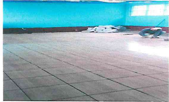
Foto 8: Sustitución de piso de torta de concreto por piso ceramico Aula 3