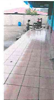
Foto 10: Sustitución de piso de granito por piso ceramico corredor