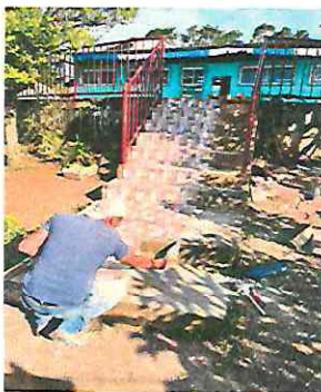
Foto 11: Sustitución de piso de torta de concreto por piso ceramico en gradas de ingreso