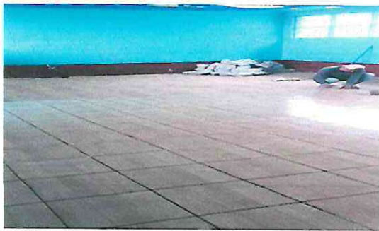
Foto 9: Sustitución de piso de granito por piso ceramico Dirección