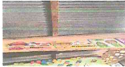
FOTO 2: Sustitucion de estructura de soporte de madera, por metal