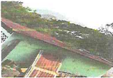
FOTO 1: Sustitución de lámina, por lámina troquelada aluzinc calibre 26