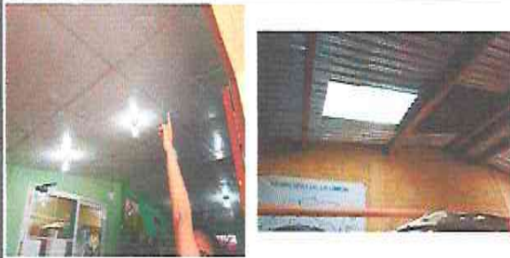
Foto 1: Dirección: Levantamiento de techo, sustitución de lamina, sustitución de costaneras.