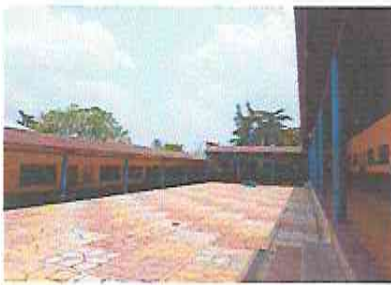
Foto 3: Patio: instalación de canales pvc e instalación de barandasl parte de abajo.