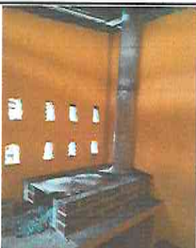
Foto 5: Sustrucción de estufa rural (completa) incluye chimenea y plancha de metal