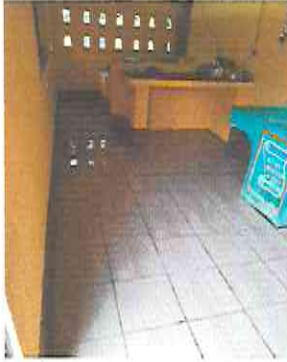
Reparación de piso cerámico