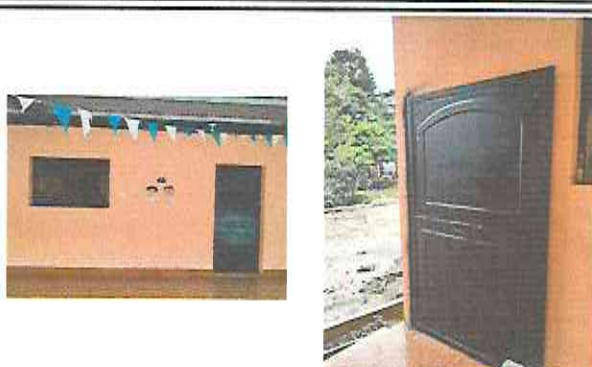
Foto 2: Mantenimiento a estructura de puerta (lijado, aplicación de pintura)