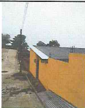
Foto 1: Sustrucción de lámina, por lámina troquelada Aluzinc calibre 26