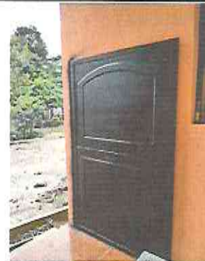
Foto 22: Sustrucción de portón de maya por portón de lámina con chapa