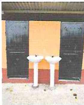
Foto 11: Mantenimiento a estructura (lijado, aplicación de pintura) a puertas servicios sanitarios