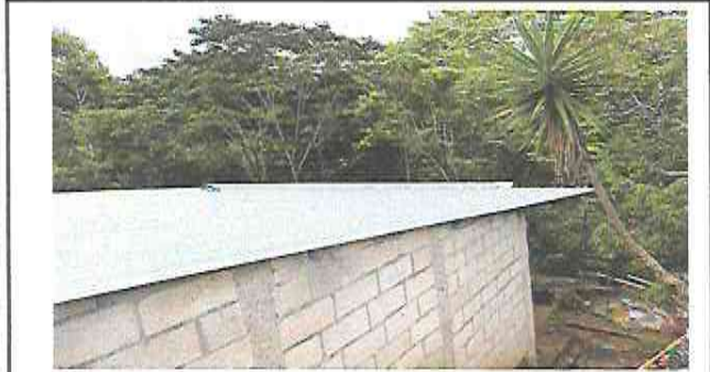
Foto1: Módulo 1: mantenimiento en soporte de metal