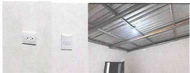
Foto 3: Módulo 1: Sustitución de focos ahorradores, plafoneras, interruptores simples y tomacorrientes