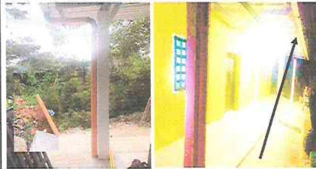
Foto7: Módulo 1: Sustitución de canal de metal y Sustitución de bajada de agua pluvial , tubo PVC 3"