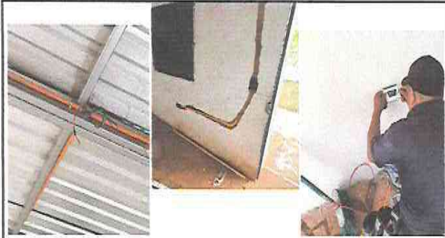
Foto 3: Módulo 1: Sustitución de focos ahorradores, plafoneras, interruptores simples y tomacorrientes