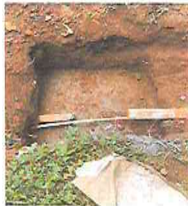
Foto7: Módulo 1: Sustitución de canal de metal y Sustitución de bajada de agua pluvial , tubo PVC 3"