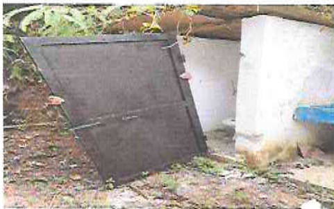
Foto 3: Módulo de baños: Sustitución de puerta en servicio sanitario