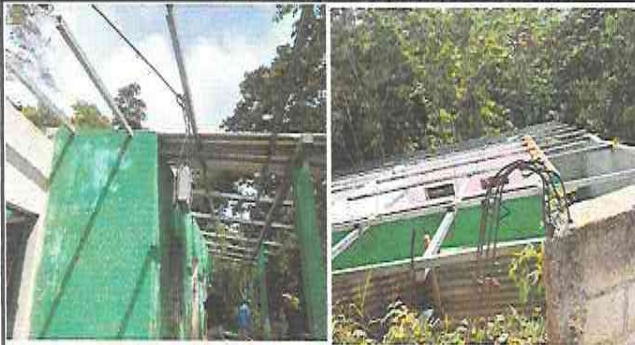
Foto1: Módulo 1: mantenimiento en soporte de metal y Sustitución de cubierta metálica con lámina troquelada calibre 26