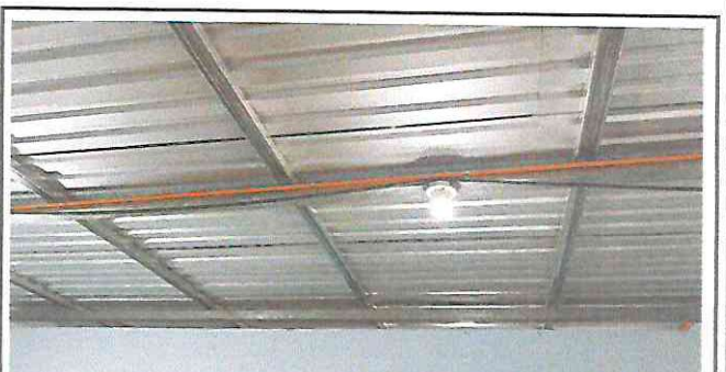
Foto 6: Reparación de cable eléctrico, cable sólido #10 línea principal y ramales cable #12 y cambiar tomacorrientes y apagadores.

Observación: Si es necesario se pueden agregar hojas adicionales y actualizar el número de hojas.