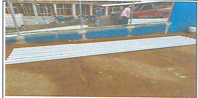
Foto 1: Sustitución de lámina, por lámina troquelada aluzinc calibre 26