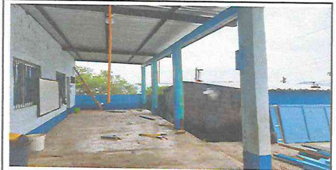
Foto 5: Sustitución de pared de lámina y playwoo por block (tiene columnas)