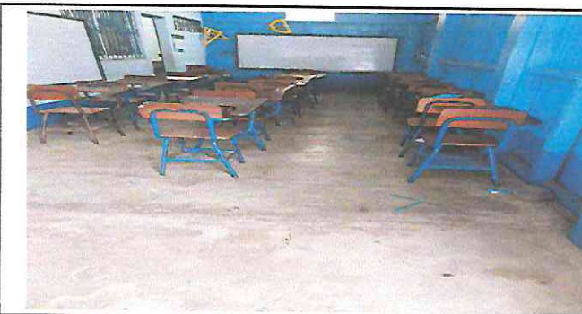
Foto 5: Sustitución de pared de lámina y playwoo por block (tiene columnas)