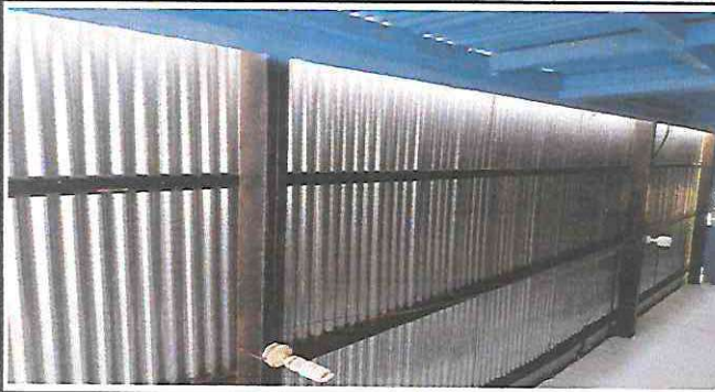
Foto 1: Sustitución de lámina, por lámina troquelada aluzinc calibre 26