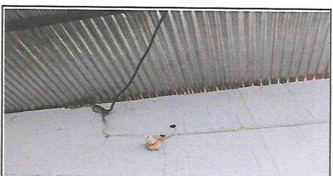
Foto 6: Reparación de cable eléctrico, cable sólido #10 línea principal y ramales cable #12 y cambiar tomacorrientes y apagadores.

Observación: Si es necesario se pueden agregar hojas adicionales y actualizar el número de hojas.