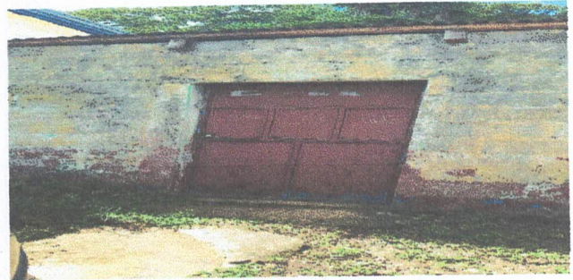
FOTO 1, En esta fotografía se puede evidenciar el deterioro de la puerta de la cocina, con el cambio de la misma se podrá abrir, ya que por el momento se encuentra cerrada porque se encuentra podrida, sus bases donde se sostiene.

Observación: Si es necesario se pueden agregar hojas adicionales y actualizar el número de hojas.