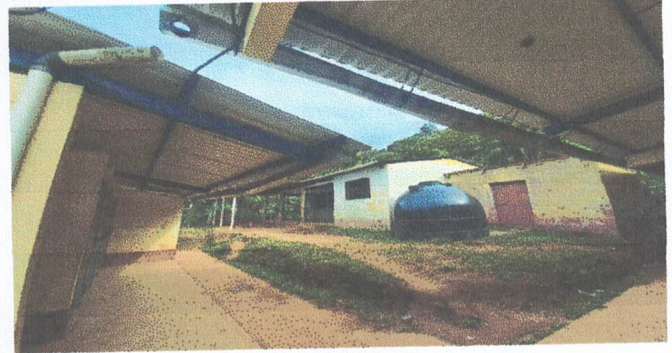
Foto 2. En esta parte se muestra que las canaletas están mal colocada, debido a que las bases se encuentran quedradas y no están deteniendo a los canales y bajadas de agua, se le hará el mantenimiento y se colocaran las bases de los canales que se encuentran deteriorados.