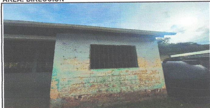
Foto 1: En esta fotografía se puede observar el mal estado del balcon y también la falta de ventana.