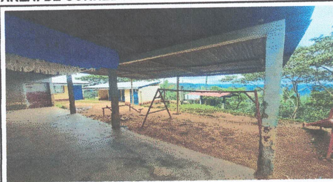
Foto 1: en la fotografia se observa que las columnas se encuentran en mal estado, son tres columnas que estan en el corredor de una aula, con el saneamiento de las columnas se evita que se sigan deteriorando y tenga mas años de utilidad.