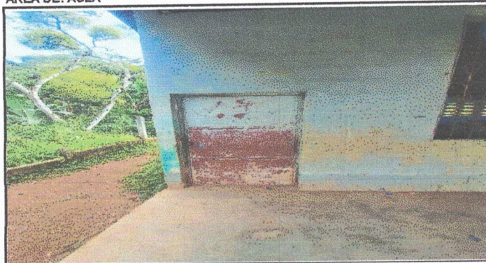
Foto 1: En esta fotografía se evidencia el deterioro de la puerta del salón de clases, la puerta no se puede abrir porque esta podrida.