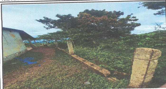
Foto1: En esta fotografía se muestra que no tiene la malla y las columnas se encuentran en malas condiciones, porque el hierro ya esta corroido y ya no soporta la malla, por ese motivo se van a demoler, solo las columnas en mal estado