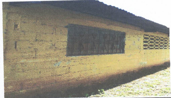
Foto 2: En esta fotografía se muestra que la ventana se encuentra deteriorada y necesita el cambio, porque la que se encuentra ya esta podrida.