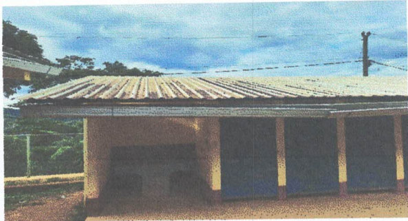
Foto 3: Esta es la parte de los baños, los canales se encuentran amarrados con pita y alambre de amarre para que se detengan, la bajada de agua también se encuentra en la misma situación.