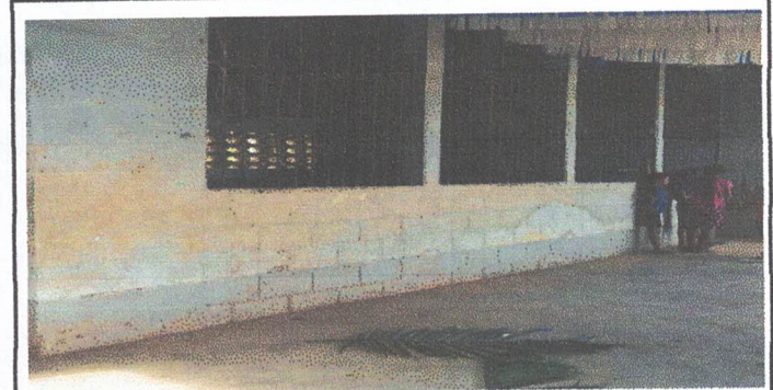
Foto 2: Los balcones del salón de clases, se encuentran deteriorados porque varios de los barrotes ya se encuentran desprendidos del balcon, también necesitan una limpieza y pintura.