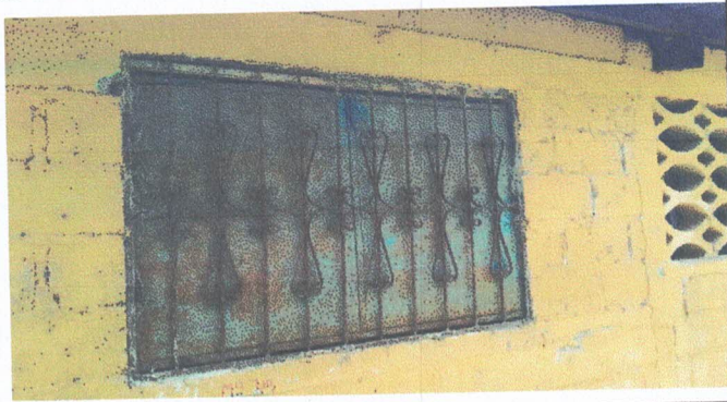
Foto 1: En esta fotografía se observa que el balcon necesita limpieza y pintura, con el mantenimiento del balcon se tiene asegurado que se puede seguir utilizando.