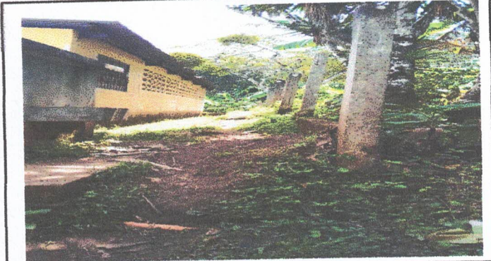
Foto 2: Aquí se muestra la parte de atrás del centro educativo, también hay columnas en malas condiciones, se necesita limpieza de la solera y se tiene que colocar hiladas de block de uve para poder tener mejor resistencia de la malla