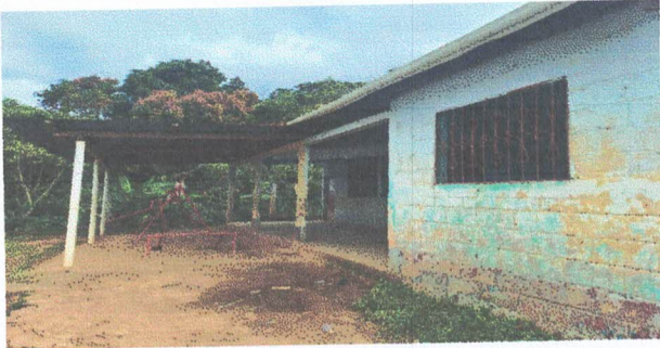
Foto1: En esta fotografía se muestra que el canal no cuenta con las bases que la detienen, se le hará el mantenimiento y limpieza del mismo, colocando de manera que pueda ser funcional.