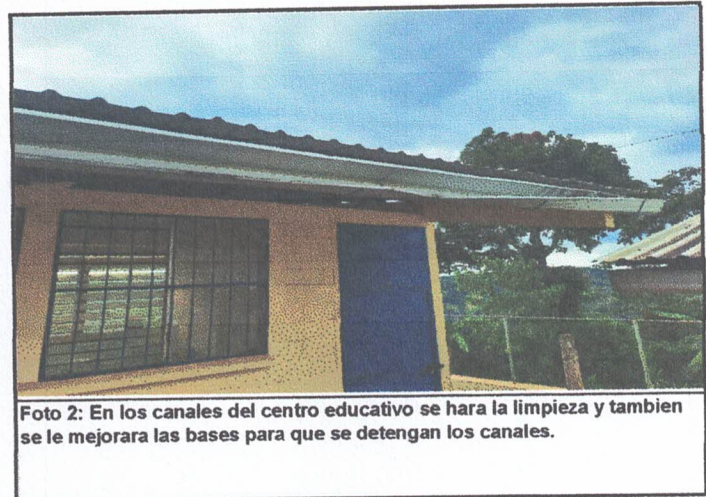
Foto 2: En los canales del centro educativo se hara la limpieza y tambien se le mejorara las bases para que se detengan los canales.

Observación: Si es necesario se pueden agregar hojas adicionales y actualizar el número de hojas.