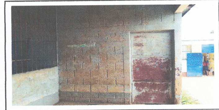
Foto 2: en esta fotografía se evidencia que la puerta de la dirección se encuentra en pesimas condiciones.

Observación: Si es necesario se pueden agregar hojas adicionales y actualizar el número de hojas.