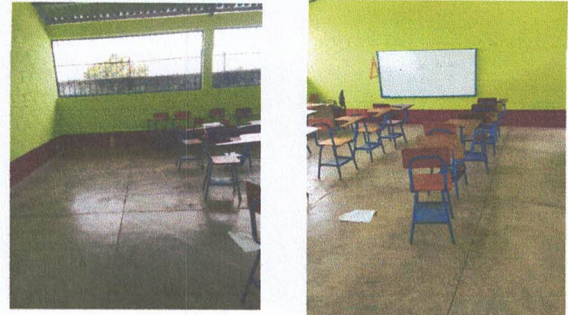
Foto 2: Se Sustituira el piso de concreto por piso ceramico en el aula #2