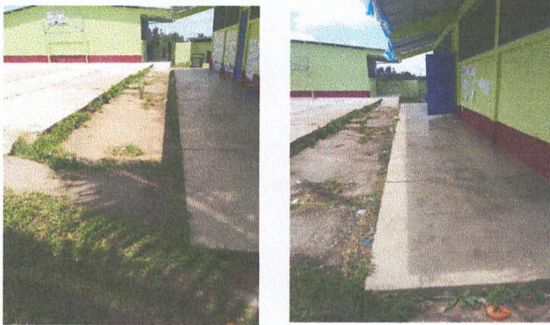
Foto 3: Se Sustituira el piso de concreto por piso ceramico en el corredor