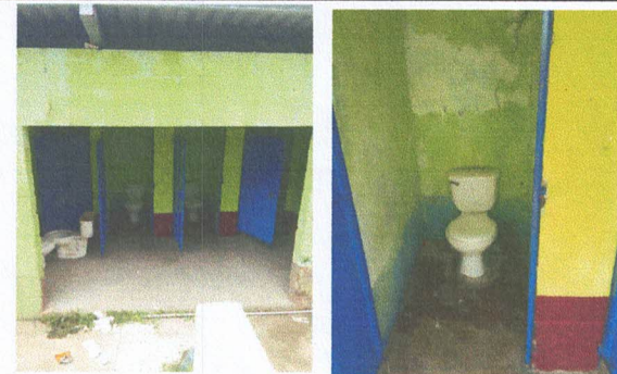
Foto 4: Se instalara azulejo y ceramico antideslizante en los baños