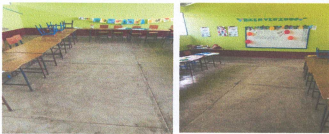
Foto1: Se Sustituira el piso de concreto por piso ceramico en el aula #1