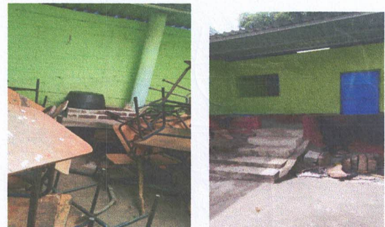
Foto 6: Se fundira una plancha de concreto y se intalara una nueva chimenea y se le instalara azulejo a la plancha de la cocina

Observación: Si es necesario se pueden agregar hojas adicionales y actualizar el número de hojas.