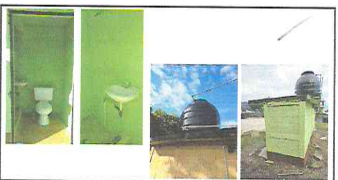
Foto 6: Sustitución de mezcladora lavamanos (contra llave, tubo de abasto), Sustitución de accesorios inodoro (contra llave, tubo de abasto y tanque), Pintura en muros interiores y exteriores, Sustitución de depósito de agua 1100 lt

Observación: Si es necesario se pueden agregar hojas adicionales y actualizar el número de hojas.