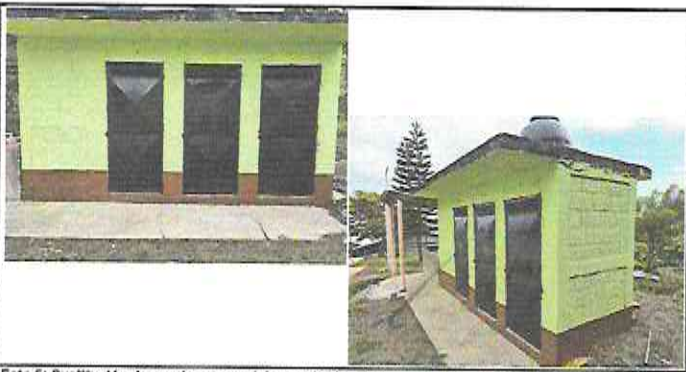
Foto 5: Sustitución de puertas en servicios sanitarios de 2 mts de alto x 0.88 de ancho, Sustitución de plafoneras, Sustitución de interruptores simples (incluye instalación de canaletas), Sustitución de lámparas tipo LED de LISTÓN, Sustitución de cableado eléctrico, Sustitución de tapadera sanitario