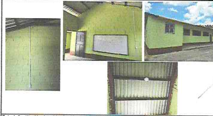
Foto 1. Sustitución de cableado eléctrico, Sustitución de lámparas tipo LED de LISTÓN, Sustitución de interruptores simples (incluye instalación de canaletas), Sustitución de tomacorrientes dobles, Sustitución tablero de filipones, Sustitución de ducto eléctrico + accesorios