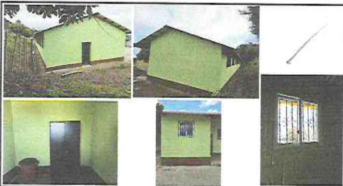
Foto 3. Pintura en muros interiores y exteriores, Sustitución de ventanas de metal por pvc más vidrio