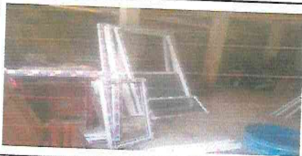
Foto 5: sustitución de balcones y colocación de ventanas corredizas de PVC