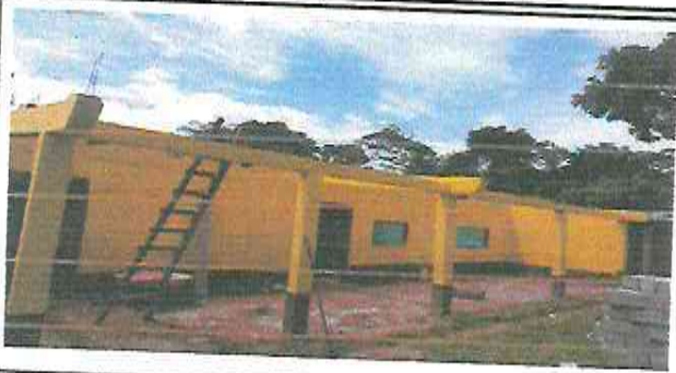
Foto 1: sustitución de laminas por laminas troqueladas calibre 26