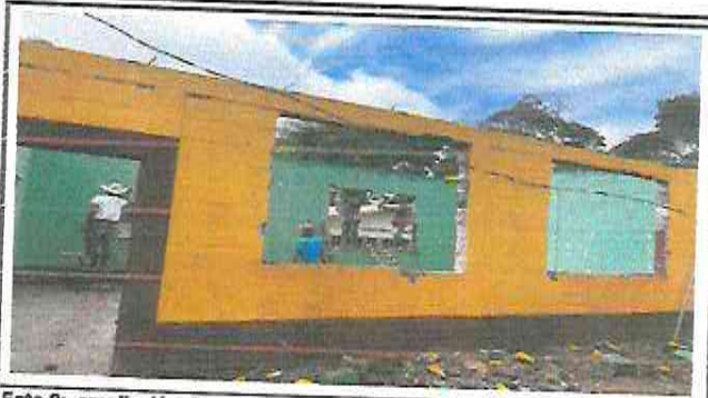
Foto 2: ampliación de ventanas y colocación de balcones y ventanas corredizas