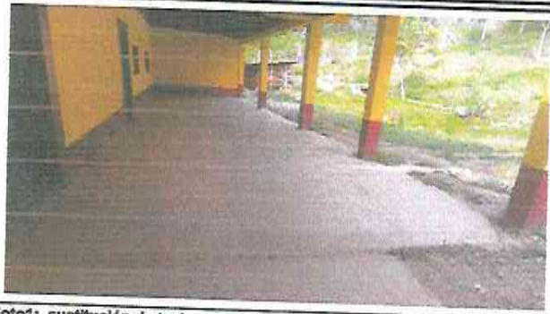
Foto1: sustitución de torta