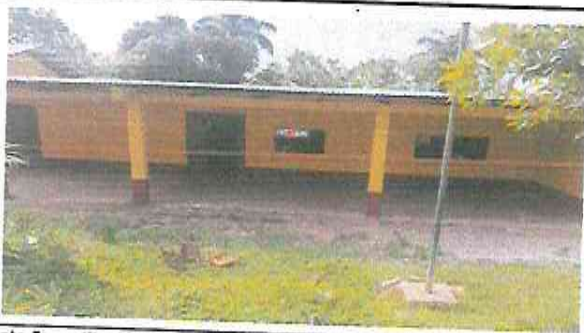
Foto 5: sustitución de laminas por laminas troqueladas calibre 26