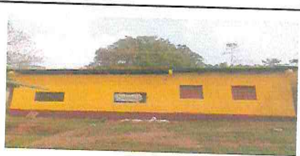
Foto 6: ampliación de ventanas y colocación de balcones y ventanas corredizas

Observación: Si es necesario se pueden agregar hojas adicionales y actualizar el número de hojas.