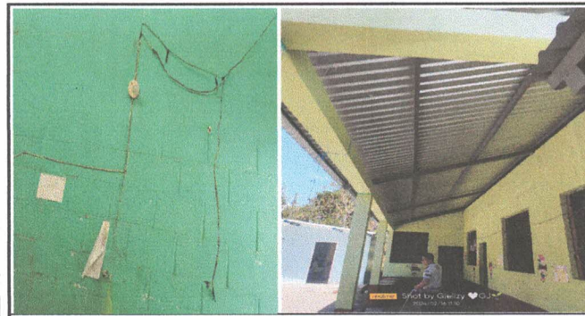
Foto 5: Mantenimiento y sustitución del sistema electrico general