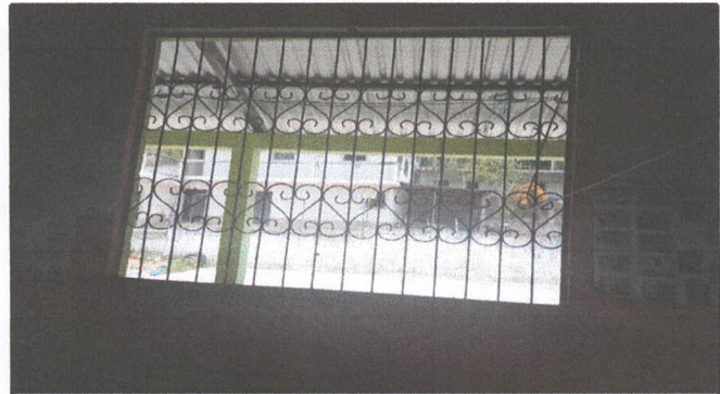
Foto 4: Sustitución de balcon de metal por metal por deterioro natural