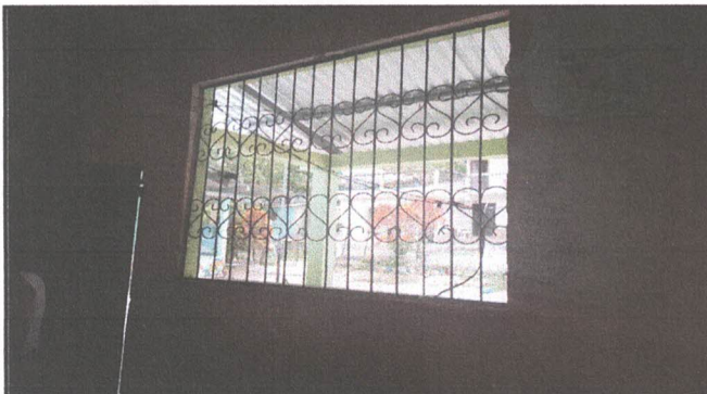
Foto 3: sustitución de balcon de metal por metal por deterioro natural