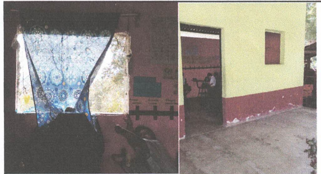
Foto 4: Sustitución de balcon y ventana de metal por balcon de metal