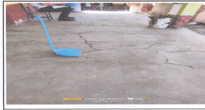
Foto 6: sustitución de piso de cemento líquido por piso de cemento líquido

Observación: Si es necesario se pueden agregar hojas adicionales y actualizar el número de hojas.