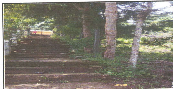
Foto 6: 2.3. CAMBIO DE CERCADO DE ALAMBRE Y POSTES DE MADERA POR MAYA CICLONICA Y TUBERIA METALICA, PARTE FRONTAL AL MURO PERIMETRAL.

Observación: Si es necesario se pueden agregar hojas adicionales y actualizar el número de hojas.