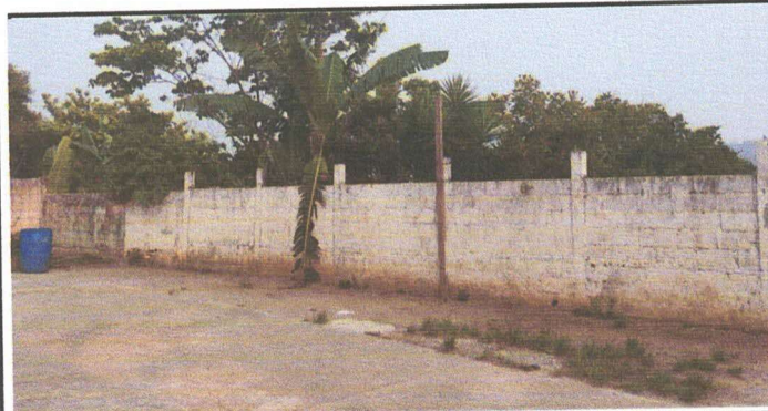
Foto 3: 2.1. INSTALACION DE SOLERA, TUBERIA METALICA Y MAYA CICLONICA EN MURO PERIMETRAL PARTE FRONTAL DEL ESTABLECIMIENTO.