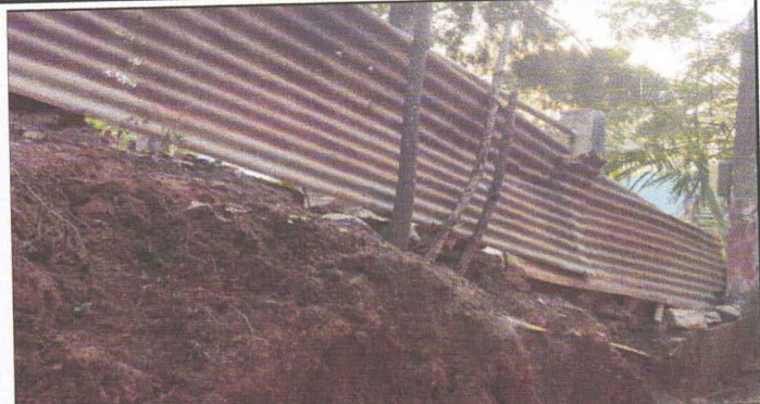
FOTO 2. 1.2. INSTALACION DE MAYA CICLONICA CON TUBERIA METALICA SOBRE EL MURO .