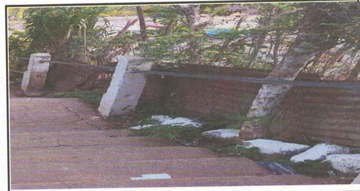
Foto 4: 2.2. CAMBIO DE CERCADO DE ALAMBRE Y POSTES DE MADERA POR BLOCK, MAYA CICLONICA Y TUBERIA METALICA