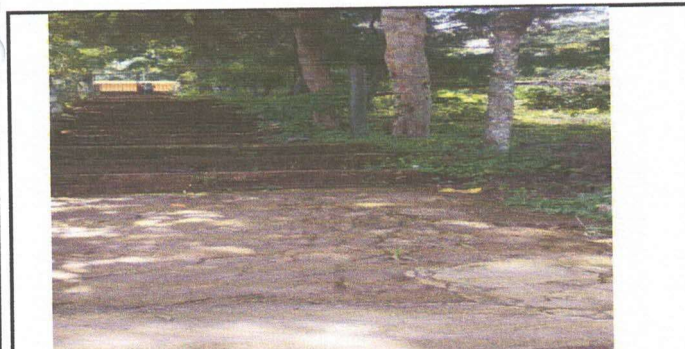
Foto 5: 2.3. CAMBIO DE CERCADO DE ALAMBRE Y POSTES DE MADERA POR MAYA CICLONICA Y TUBERIA METALICA, PARTE FRONTAL AL MURO PERIMETRAL