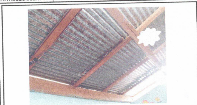
Foto1: Lámina de techo en mal estado.